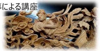
彫刻士による仏壇の彫刻